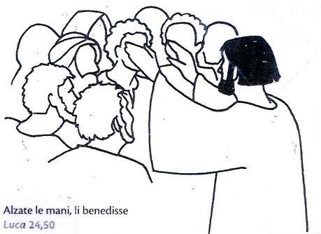
Alzate le mani, li benedisse Luca 24,50

Al termine di questa vita incarnata per noi, si compie la grande avventura umana-divina di Gesù: “è salito al cielo, siede alla destra del Padre” .